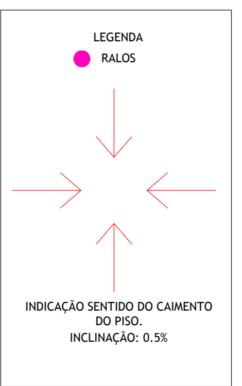
PLANTA DE RALO ESCALA: 1/75