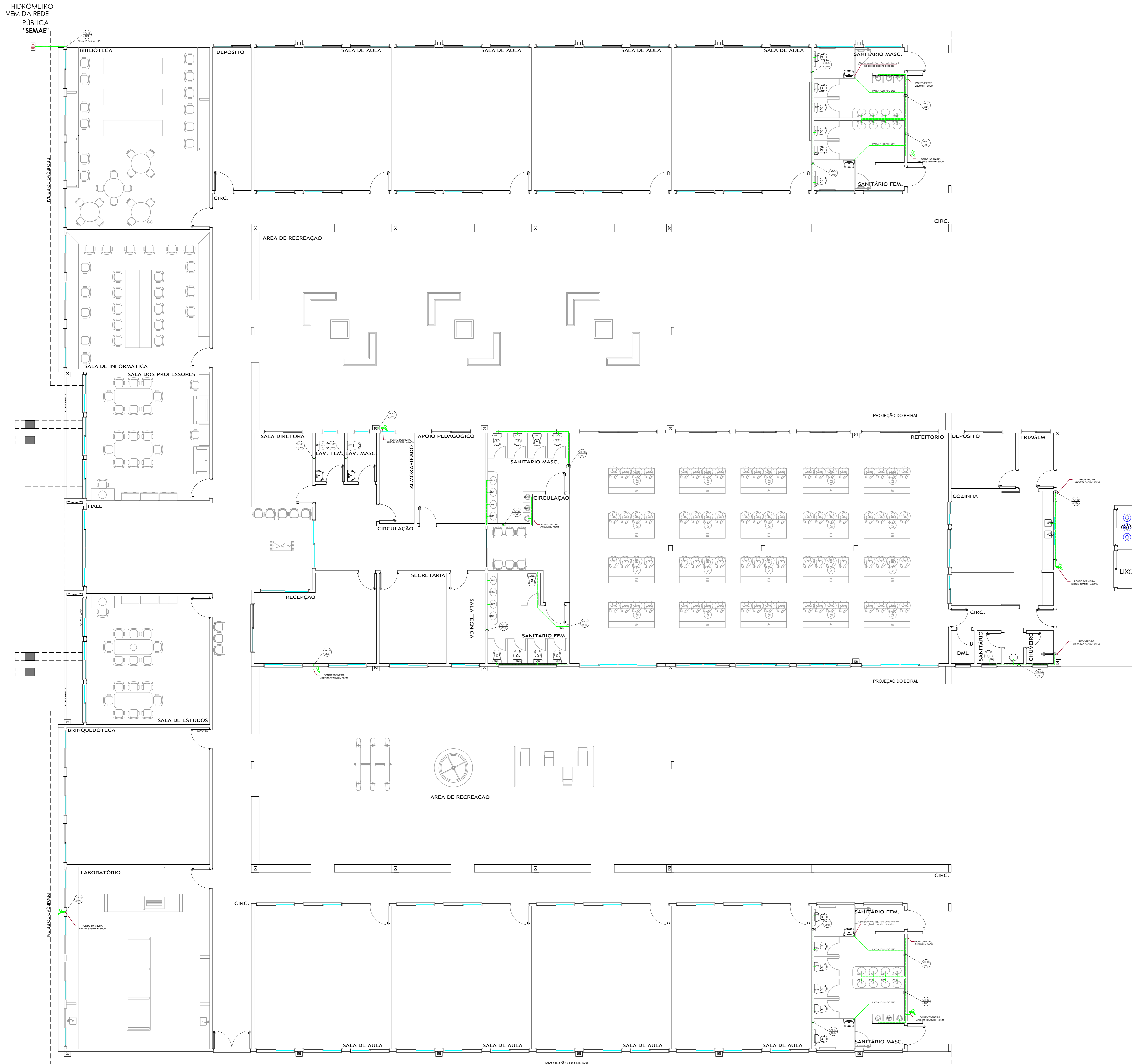
PLANTA BAIXA - ÁGUA FRIA ESCALA: 1/75