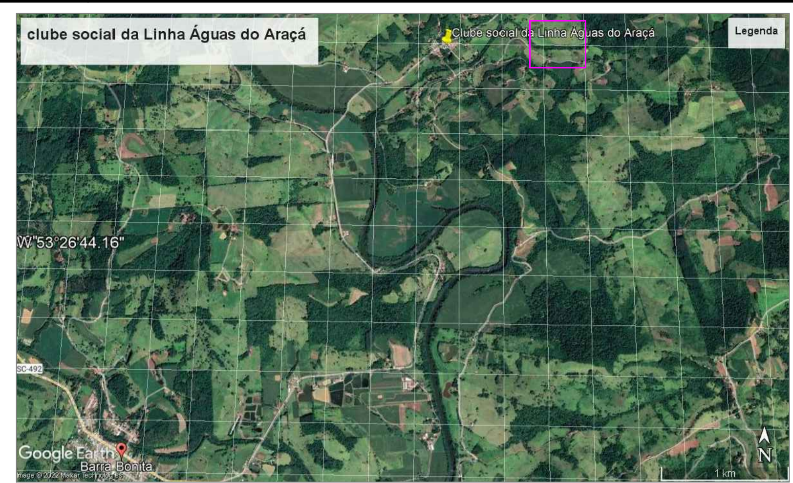
MAPA DE SITUAÇÃO elaborada apartir de imagens de satélite para facilitar na identificação do lote - imagem salva em dez/2018 Escala: Sem