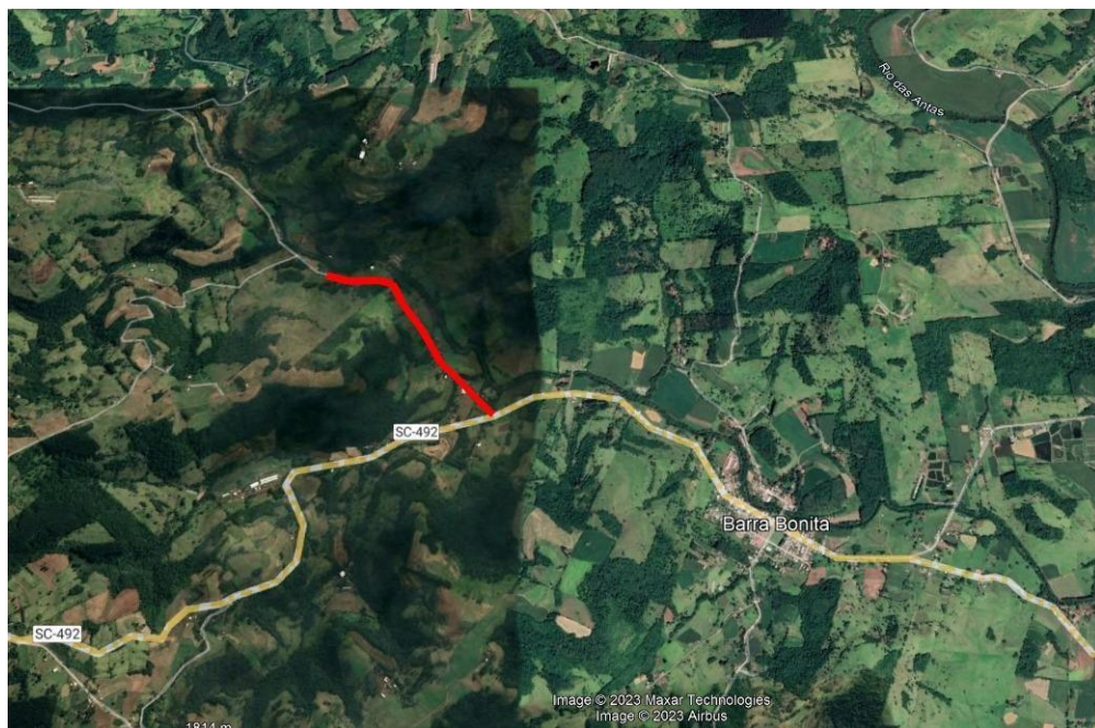
Figura 1: Estrada geral para Linha Traíra

CONTRATAÇÃO DE EMPRESA ESPECIALIZADA NA PRESTAÇÃO DE SERVIÇOS DE ENGENHARIA E/OU ARQUITETURA DESTINADOS A ELABORAÇÃO DE PROJETOS EXECUTIVOS PARA PAVIMENTAÇÃO ASFÁLTICA, DRENAGEM PLUVIAL E SINALIZAÇÃO VIÁRIA, NA ESTRADA GERAL PARA LINHA TRAÍRA, ESTRADA GERAL PARA LINHA ARAPONGAS E ESTRADA GERAL PARA LINHA CAÇADOR BAIXO, LOCALIZADAS NO INTERIOR DO MUNICÍPIO DE BARRA BONITA/ SC.